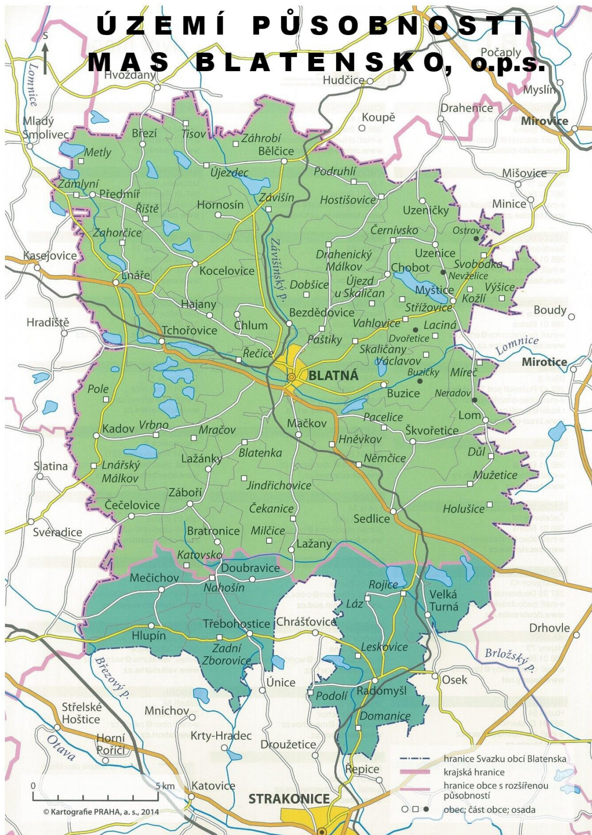
Obrázek 1: Území působnosti MAS Blatensko, o.p.s. s vyznačením hranic obcí